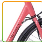
női korall/ fekete