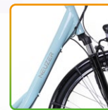
női babyblue/ barna