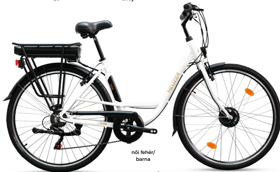
női fehér/ barna

váz/frame: al6061 alu nagy teherbírású/extra durable