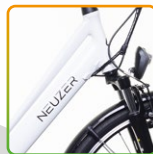
női fehér/ fekete