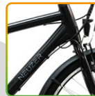
férfi fekete/ szürke