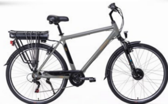
férfi szürke/barna fekete