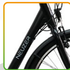
női fekete/ kék