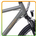
férfi szürke/ barna fekete