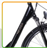
női fekete/ barna