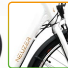
női fehér/ barna