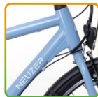
férfi világoskék/ fehér