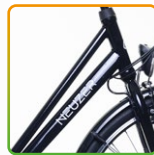
női fekete/ fehér

váz/frame: al6061 alu nagy teherbírású/extra durable*