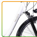
női fehér/ barna