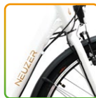
női fehér/ barna