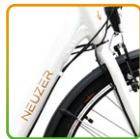
női fehér/ fekete