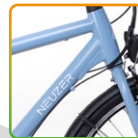
férfi világoskék/ fehér