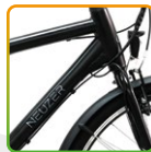
férfi fekete/ szürke

extrák/extras: sárvédő, elemes világítás, kitámasztó/ mudguards, batery lights, kickstand