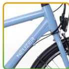
férfi világoskék/ barna