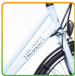
női babyblue/ fekete