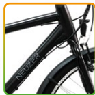
férfi fekete/ szürke